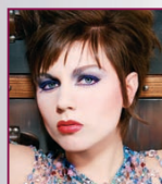
Make-up Aisha Rokovskiy